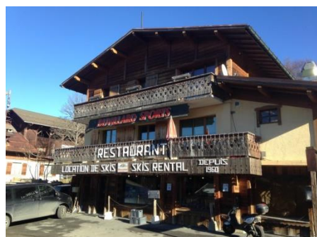
Restaurant et magasin de sports