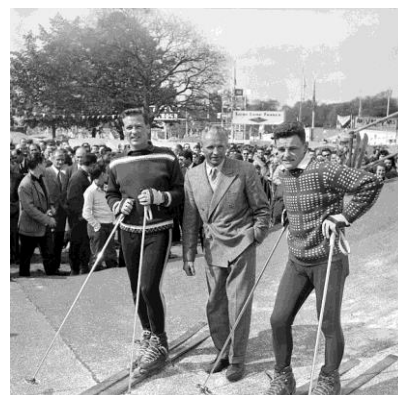
Arrivée de course